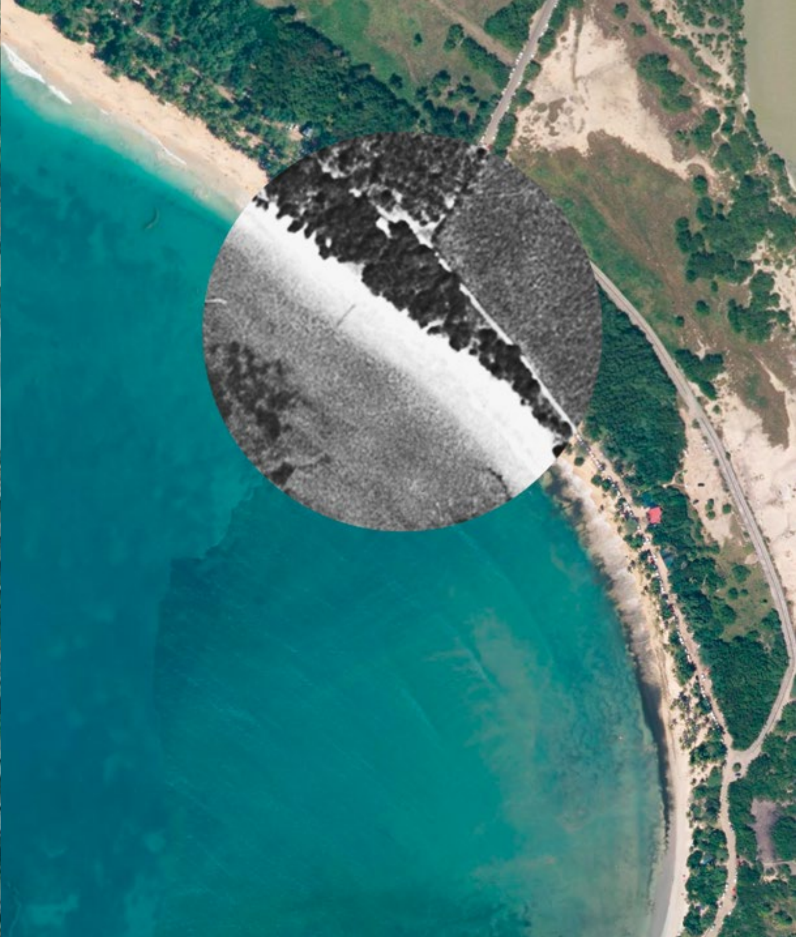
LIEU : ANSE DES SALINES – MARTINIQUE Dates : 1951-2017